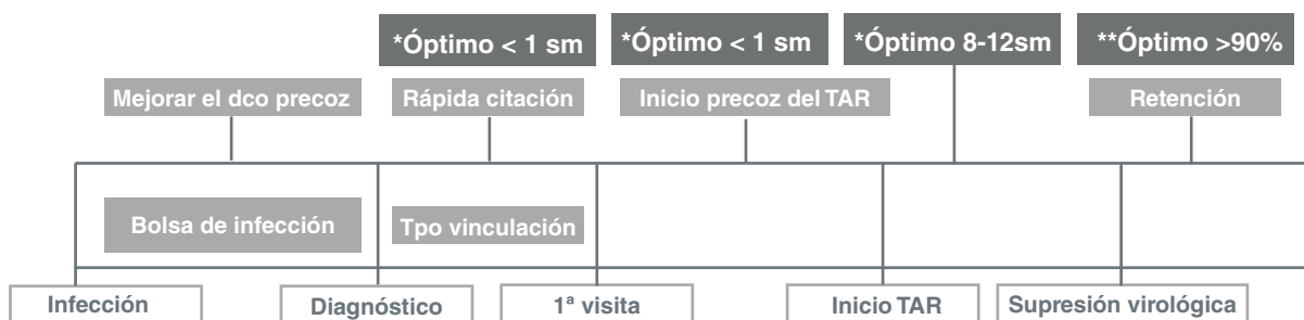
Figura 1. Diferentes puntos desde el momento de la infección hasta la vinculación y supresión virológica

**Los tiempos son estimativos y se pueden alargar por múltiples circunstancias relacionadas con la gestión de la consulta y/o del paciente.